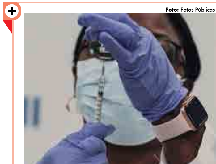
Serão vacinadas pessoas em todas as regiões da Paraíba