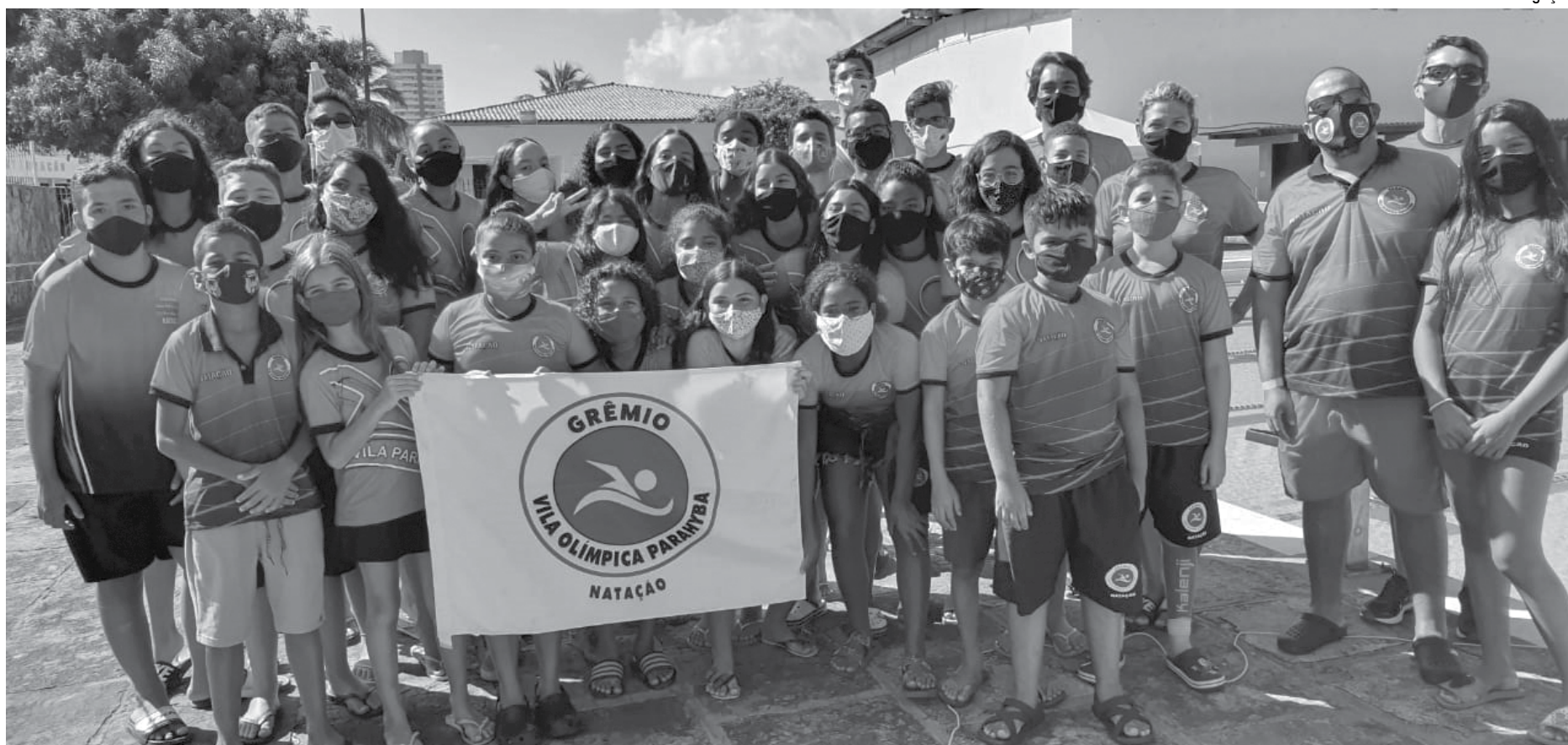
Delegação paraibana que participou do Festival de Natação em comemoração aos 50 anos da Federação Northeriogrândense com a conquista de 48 medalhas de ouro, 30 de prata e 18 de bronze