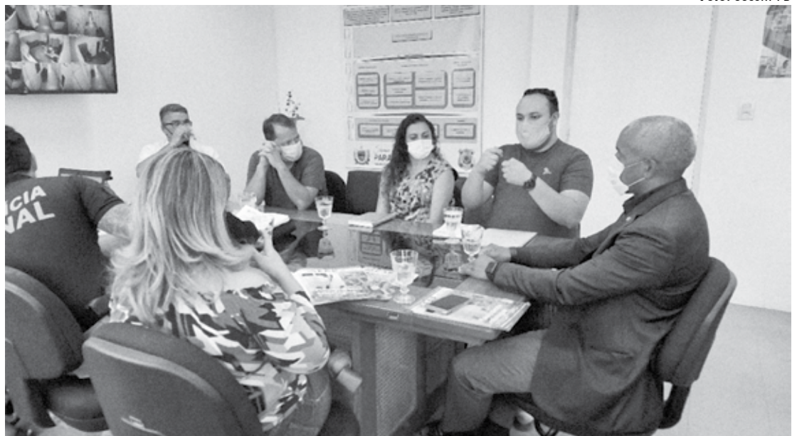
Na última sexta-feira, os projetos do Humanitas foram apresentados em reunião na Secretaria da Administração Penitenciária