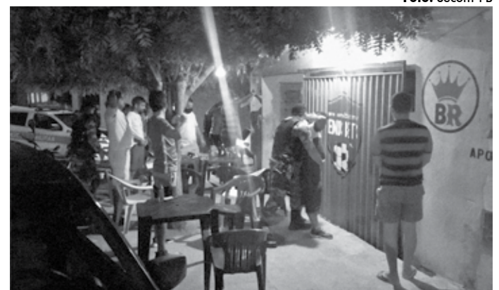
No domingo, dois eventos foram encerrados por promoverem aglomeração