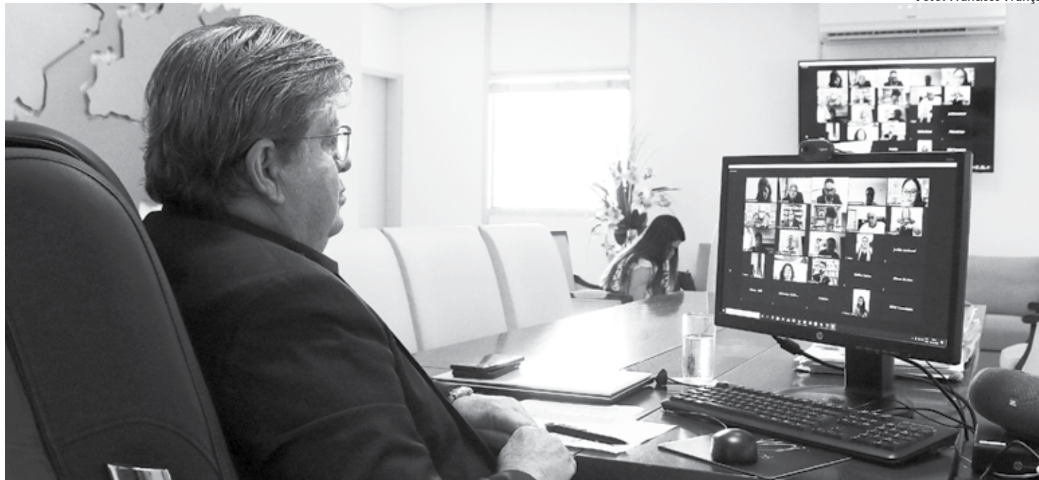
Governador João Azevêdo empossou os membros da Comissão Estadual de Prevenção à Violência no Campo e na Cidade através de solenidade virtual