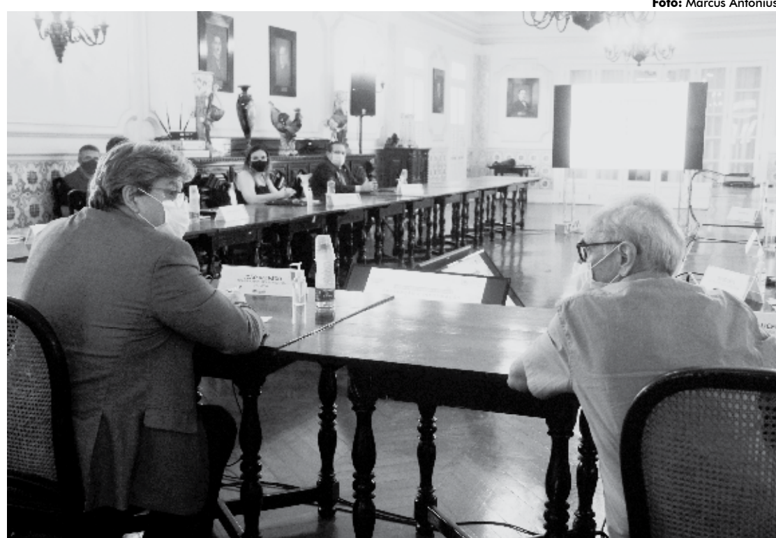
João Azevêdo e Cícero Lucena pediram à população que respeite as regras de prevenção para evitar contágio da covid-19

“O que estamos fazendo, a partir desse pico que está acontecendo, é que nós vamos reforçar, principalmente, para o funcionamento de bares, restaurantes e eventos, uma nova regra. Estabelecendo que, se por acaso o número de leitos ultrapassar 70% a gente teria ‘startado’ o processo para que esses municípios pudessem funcionar com horário reduzido, isso não muda em relação ao delivery. É um complemento ao plano que já existe no estado”, ressaltou o Chefe de Estado.